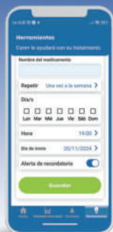
Capturas de pantalla de la aplicación Care+